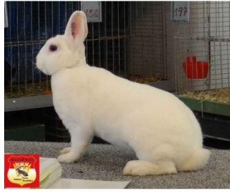
1.0 Zwerg-Rex, weiß BIA, 96,0