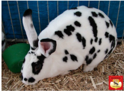
0.1 Dalmatiner-Rex sw, 96,5