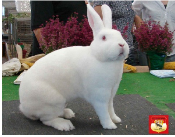
0.1 Weiß-Rex RA, 97,5 Pkte.