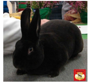
1.0 Schwarz-Rex, 97,0