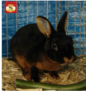
0.1 Zw-Rex, loh. schwarz 97,5