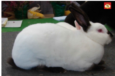
1.0 Russen-Rex sw, 97,0