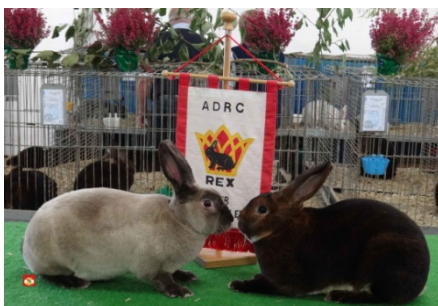
0.1 Marder Rex braun + 1.0 Castor-Rex